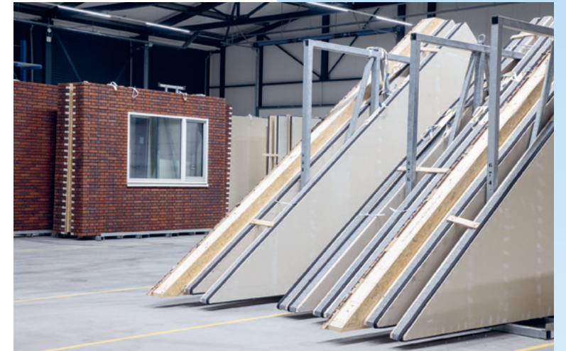
Het isolatiemateriaal in deze bouwpanelen is van natuurlijke grondstoffen gemaakt.

Biobased materialen zijn natuurlijke grondstoffen zoals graanstro, hout en vlas. Het gebruik hiervan zorgt voor minder CO 2 -uitstoot in vergelij-